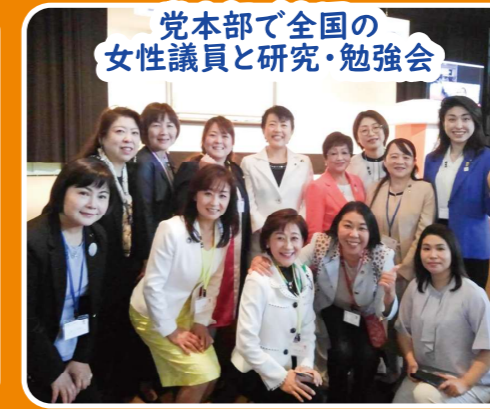
党本部で全国の女性議員と研究・勉強会