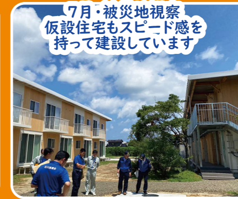
7月・被災地視察 仮設住宅もスピード感を持って建設しています