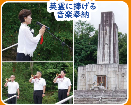
英霊に捧げる音楽奉納