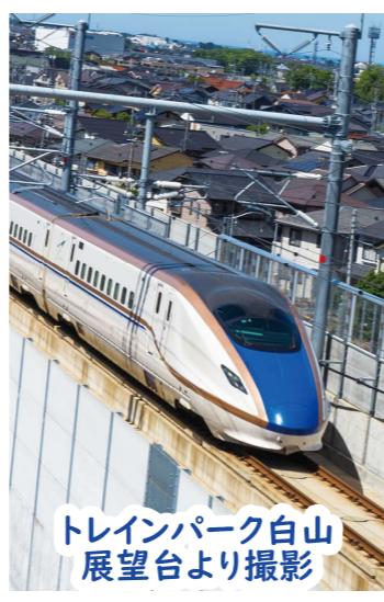
トレインパーク白山 展望台より撮影

3月16日、北陸新幹線が県内全線開業しました。停車駅の小松駅、加賀温泉駅では盛大なセレモニーが開催され、大きく盛り上がりました。小松駅はビジネスや小松空港との連携を考慮したダイヤ、加賀温泉駅は観光客を考慮したダイヤとなっています。経済や観光交流、関係人口の増加が見込まれます。敦賀から大阪までも、早期開業を目指したいのですが、環境影響評価手続きの遅れなどにより、着工の目途が立っていません。このことから、工期が短く費用の少ない米原ルートを再考する意見もあります。