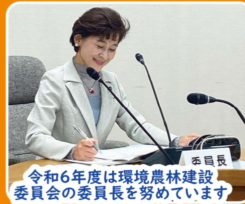
令和6年度は環境農林建設委員会の委員長を務めています