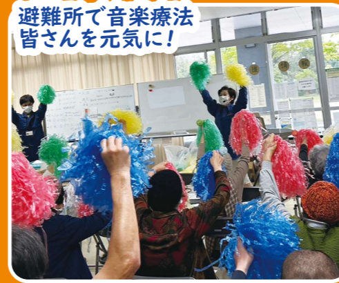
避難所で音楽療法 皆さんを元気に!